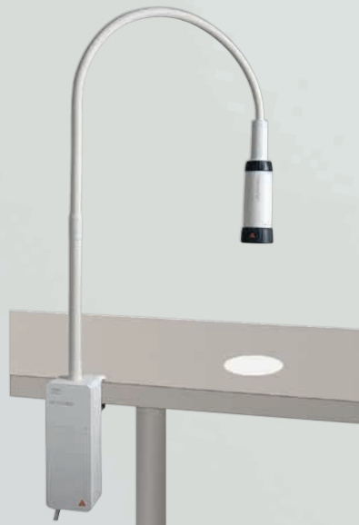
EL10 LED Untersuchungsleuchte mit Klemmhalterung

Nähere Informationen finden Sie auf www.heine.com