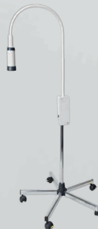
EL10 LED Untersuchungsleuchte mit Rollstativ aus Metall